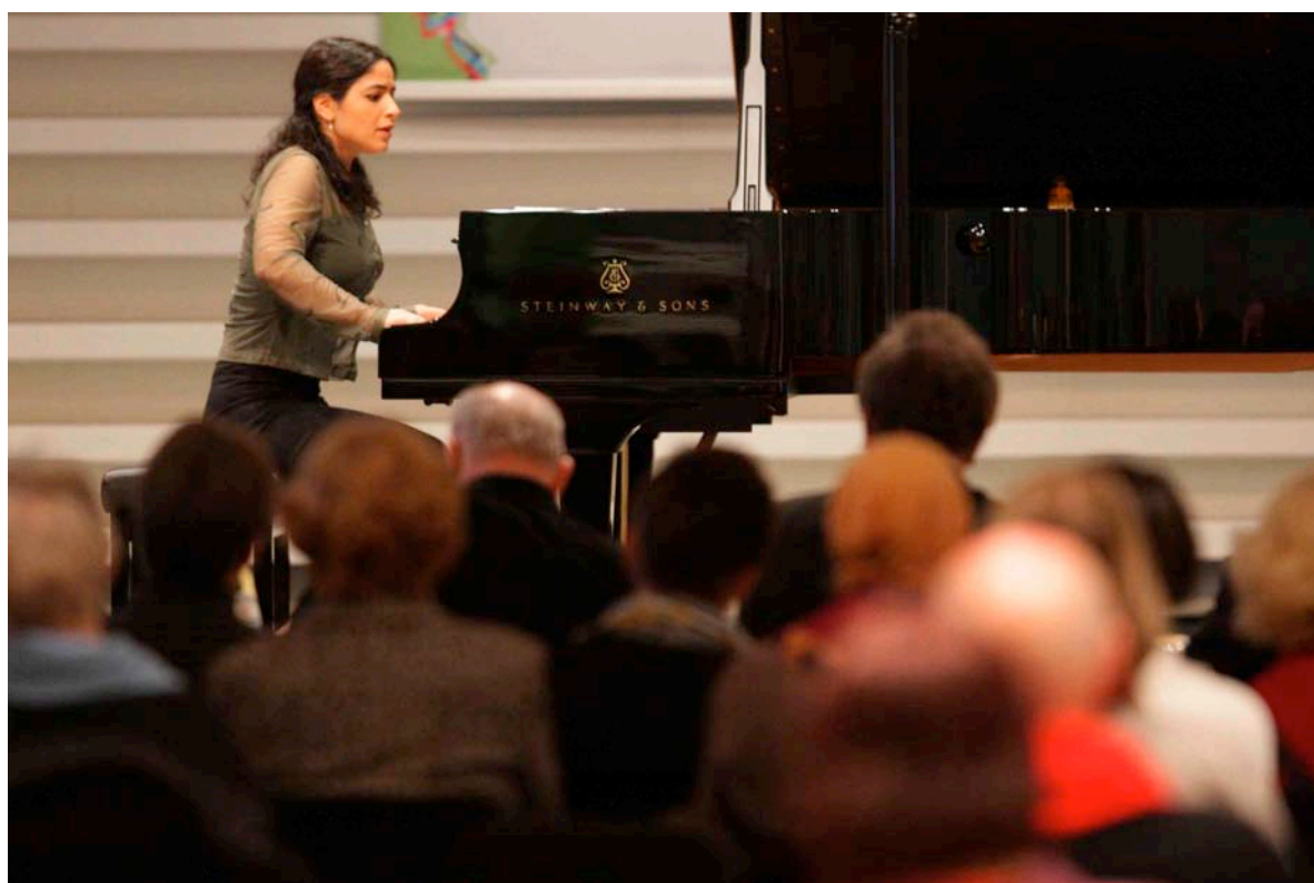
1. Runde Telekom Beethoven Competition 2009